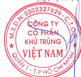
Trương Công Cứ