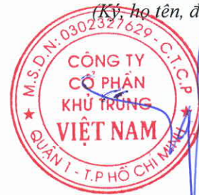
Trương Công Cứ