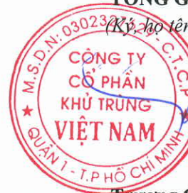
Trương Công Cừ